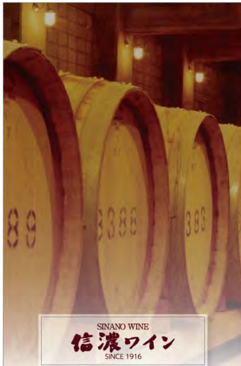
SINANO WINE 信濃ワイン SINCE 1916